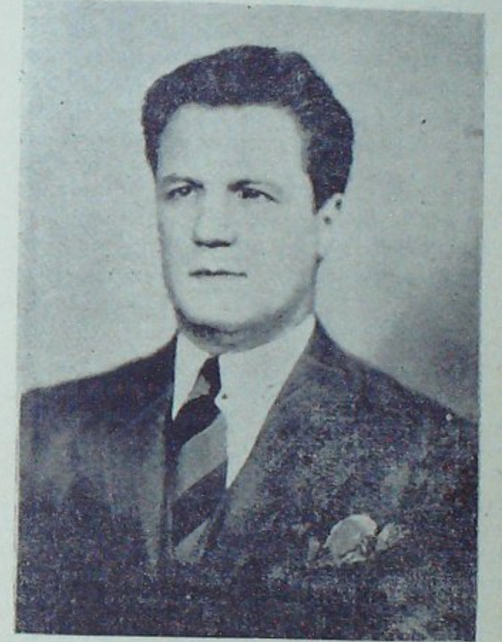
Seyhan Valisi B. Akif İyidoğan

Küçük büyük bütün çiftçilerin iş vasıtalarını arttırmak yenileştirmek tedbirleri vakit geçirilmeden alınmalıdır. Her halde en küçük bir çiftçi ailesi bir çift hayvan sahibi bulunmalıdır. Bunda ideal olan