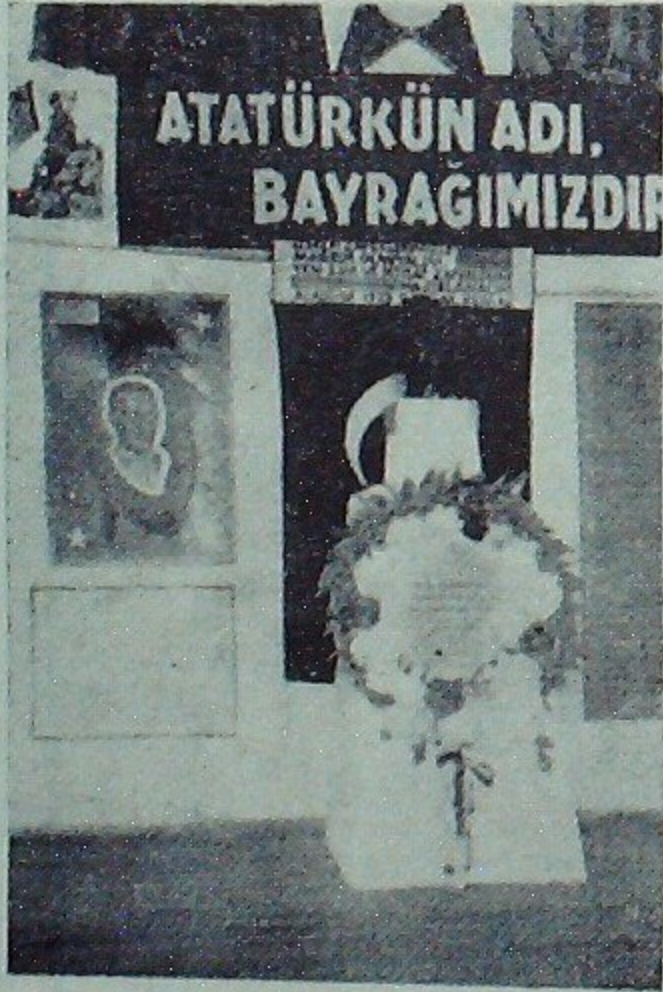
5 Kânunusani Okulundaki Atatürk köşesinden bir görünüş

Ogün tabiat bile matem tutmuştu : Rüzgârlar hareketsiz, sular sessizdi. Ani olarak ta toprağın dudağı kurumuş ve yarılı yarlıvermişti.