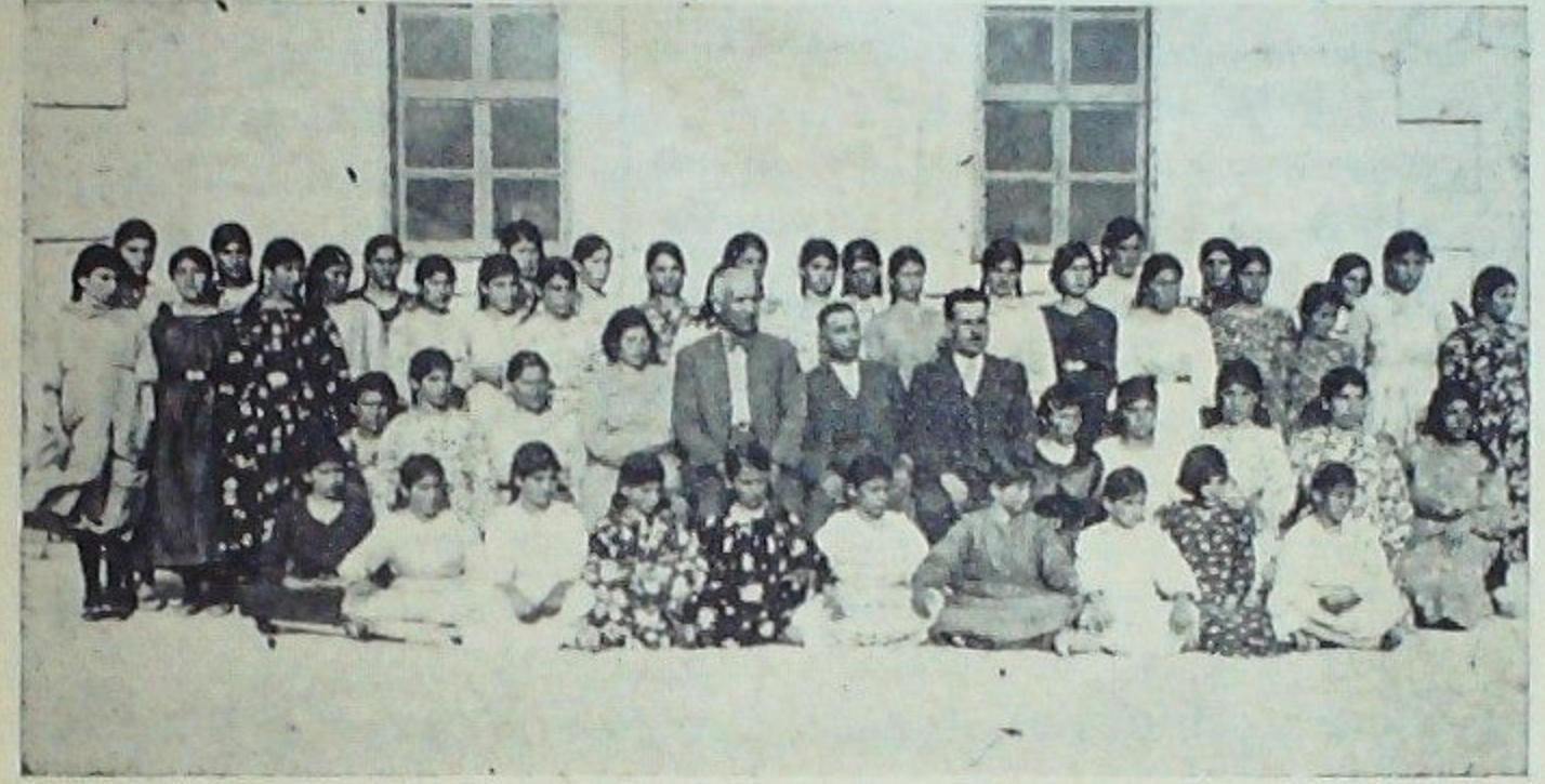
Eti Ulus okulları dersanelerinden bir grup

bu günün uyanık ve ileriye gören nesli, kurulan hars komitesinin rehberliği ile bölgemizin hakkı olan ulusal kültür birliğinin temellerini sağlam bir şekilde atmış bulunuyor. Artık, din ve itikad ticaretine nihayet veren lâayiklik, tarikat dedikodularına tiryaki olanların bu ağız sakızını da ellerinden almış oldu. Millet'in bir kan davası olmaktan ziyade fikir, duygu ve kültür işi olarak ele alındığı bu asırda bölgemizin Eti çocuklarının Türklükleri Antropoloji, etnoğrafi ve tarihin ışıkları ile parıldayan bir hakikat olarak ortaya konulmuştur. Kırk asır önce, orta asyadan dünyanın en uzak köşelerine medeniyet akıncıları gönderen