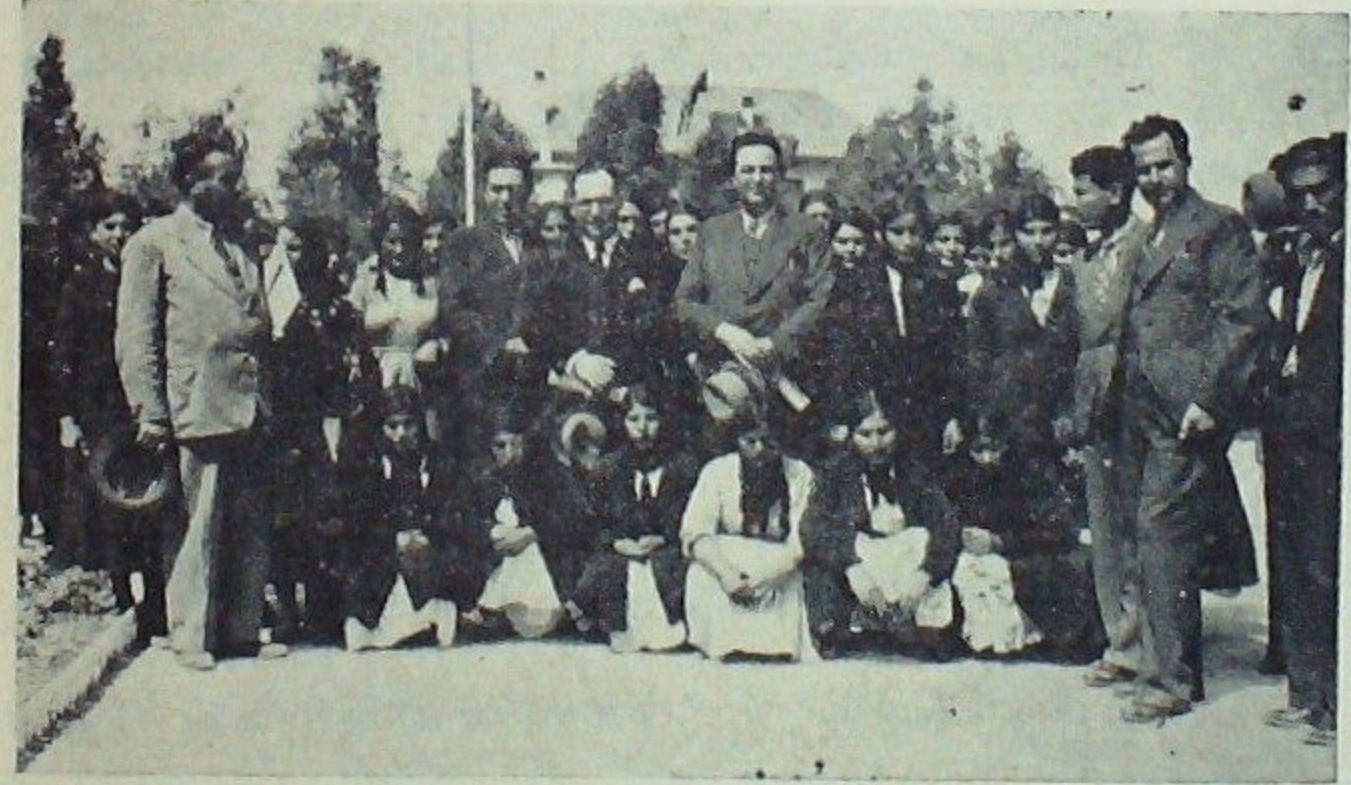
Ulus okulları belge dağıtma töreninde kadın talebeler

Türklük, Anadolu'nun cenubunda ve Hatayda bıraktığı Eti kolunu dünün köhne mezheb dedikodularına feda edemezdi. Şimdi bu ırkdaşlarımızı mezhebinden ve yabancı dil konuşmalarından bahsedene kahve dedikodularını bir tarafa bırakarak biraz da ilim ve tarih ile meşgul olmalarını tavsiye ederiz.