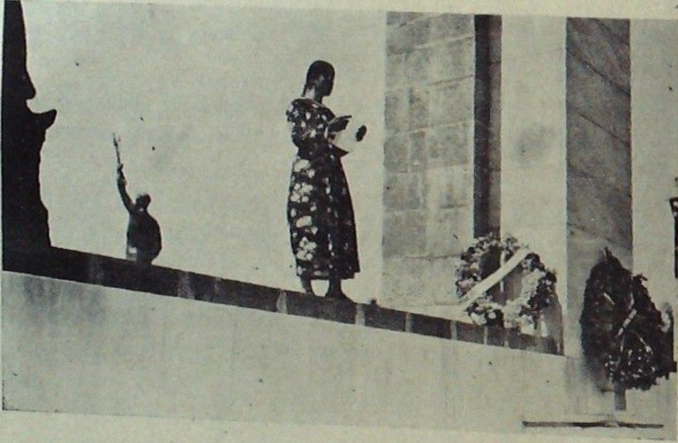
Ulus okulları belge dağıtma töreninde söylev veren Eti kız

Cumhuriyet rejiminin, yurdu her sahada canlandıran uğurlu eli bu bölge çocuklarının yüreklerinde ötedenberi kanıyan yaraya da derman verdi : Bu toprakların işgal acısı çektiği günlerde birbirine sim sıkı sanlan çukurovalılar arasında mazinin karanlık devirlerinden kalan mezheb ayrılıkları da diğer fena miraslar gibi—tarihe gömüldü. İlimin aydınlattığı yolu tutan