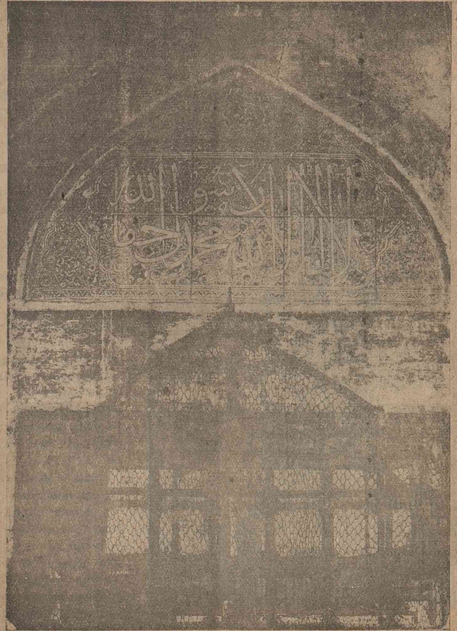
Lala Mustafa Paşa camii pencerelelerinin üstündeki çini üzerine yazılar

Olda ol devletiye hak hazreti her dem mun