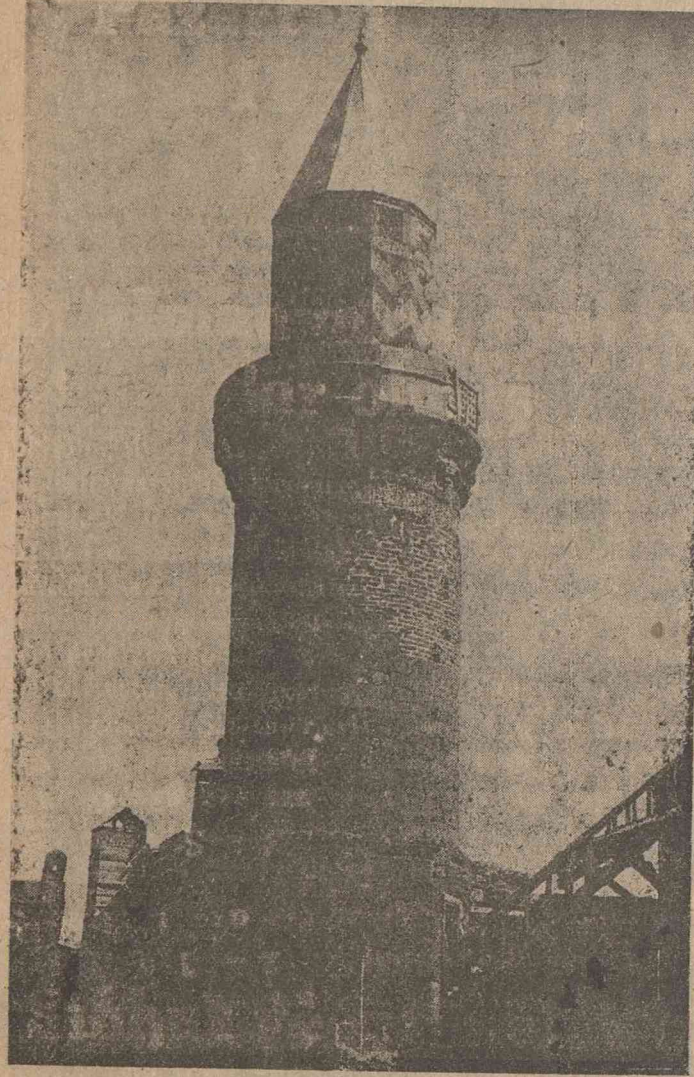
Ahmediye Darülhadisinin minaresi

Yazdı Dâî etti ihya Lala Paşa ca- miin 1106