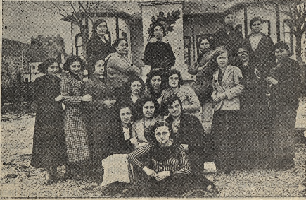
Eyimizin 936 yılı birinci devre Daktilo kursundan çıkan talebelere bir Gurup

Ne latif karşiki sahil gidelim Gidelim zeykini tesbit edelim Azacık dinlenelim Aksuda biz Binelim sandala sonra ikimiz Sen dümen tut çekeyim ben de kürek Verelim köşke kadar eğlenerek Oradan hoş görünür çünkü gurup Bakalım seyrine Parkta oturup Çatma kaş, bükme dudak hiç nafile Boyle demler her zaman geçmez ele Gelecek bir gün evet, yok olacak Şu çimenlerle çiçekler solacak Bu letafet bitecek hep bitecek Bu güzellik belki yarin gidecek