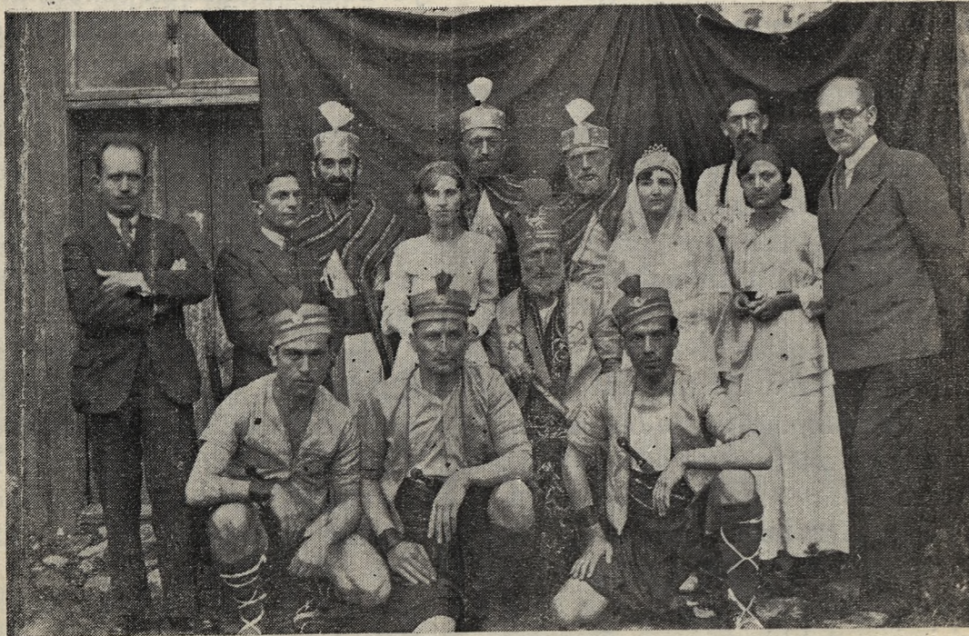
Evimizin Gösterit Şubesinin 23 Nisanda Oynadığı (Akın) Piyesinde Rol Alan Arkadaşlardan Bir Grup