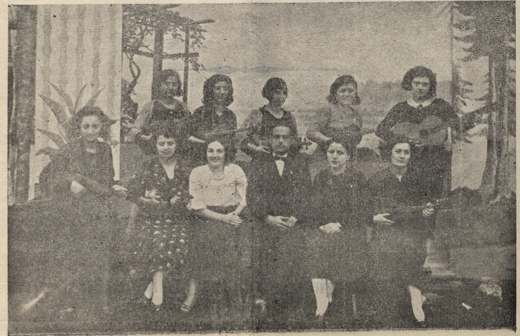
Evimizin Keman Kursunda Ders Alan Taleberden Bir Grup

§ Limanımızı ziyaret eden Hamidiye mektep gemisi kumandan ve subayları şerefine Evimizde şehir namına bir akşam çayı verilmiştir. bu ziyafette söylevler söylemişler ve denizcilerimiz şitttle alkışlanmışlardır.