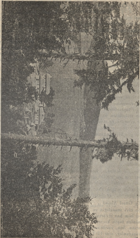
Güneşden Abant'a bakış