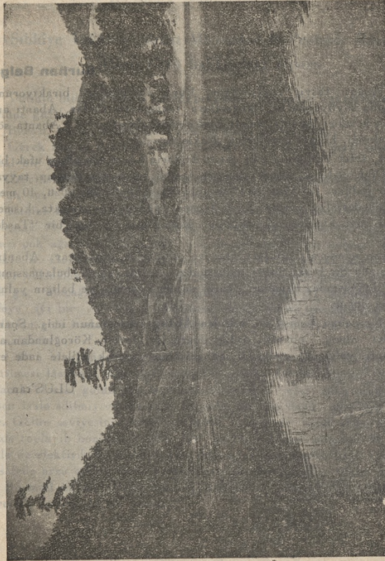
Mudurnu'ya doğru Abant