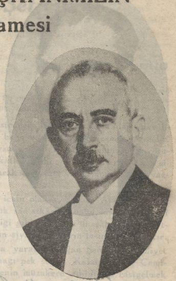
Reisicumhurbaşkanı Milli Şefimiz İSMET İNÖNÜ

Yeni Seçim sona ermiştir. Türk milleti kadın ve erkek seçmenlerin büyük nisbette iştirakiyle Milletvekillerini seçmiştir. Yeni Büyük Millet Meclisinin muhtelif Partililerden ve bağımsızlardan kurulmuş olması Vatanımız için büyük muvaffakiyettir. Milletimizi yürekten tebrik ederim. Şimdi Türkiye'nin Millî hayatında yeni bir devre giriyoruz. Her şeyden evvel Seçim zamanının sinirli sözlerini karşılıklı bağışlayarak ve unutarak vatanı huzur, çalışma devrinin açılması ilk vazifedir. Büyük Meclisteki çalışmalarda ise karşılıklı saygı içinde olarak fikir ayrılıklarını vatan için yapıcı bir şekilde ayarlamak gelecek vazifemiz olacaktır. İktidar ve karşı Partilerinin Büyük Mecliste, belâdiyelerde ve basın âleminde bir arada verimli olarak çalışabilmelerinin millette imtihanını vereceğiz. Bu imtihanın muvaffakiyetle verilmesi bu günkü ve gelecek nesiller için çok feyizli olacaktır. Vatandaşlarımın arasında dostluğun bozulmaması için bütün dikkatimizi kullanacağız. Yeni Büyük Millet Meclisinin, aziz memleket ve Milletimize kıymetli hizmetler başarmasını dilerim.