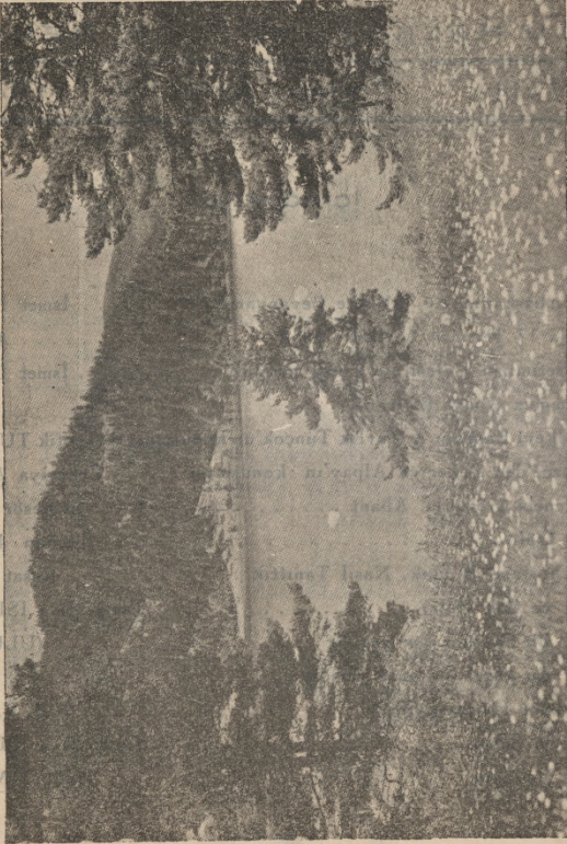
Dünyanın en güzel gölü : ABANT