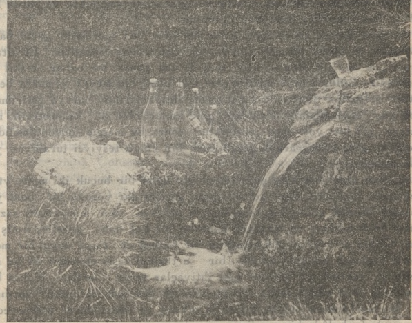
Abant yo'lu civarında Çepni maden suyu

Makesiniz olmama imkân yoktur. Bugünün heyecanını hep beraber tadıyor ve hep beraber duyuyoruz. Yurdumuzun güzelliği için ne söylesem azdır. Bu güzellikler içinde yaşayanların duyduklarını heyecanlarını bir ayna gibi aksettirmeme imkân yok. Bunun için sözlerime nihayet verirken bize bu mesut günleri temin eden büyüklerimizle sonsuz şükranlarımızı sunar yaşasın İsmet İnönü yaşasın asil Türk Milleti derim.