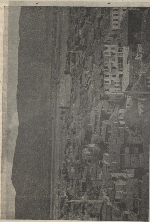
Boludan bir görünüşü

Abant'a kesin gelecek isteyenler pek çoktur. Kış sporu meraklıları