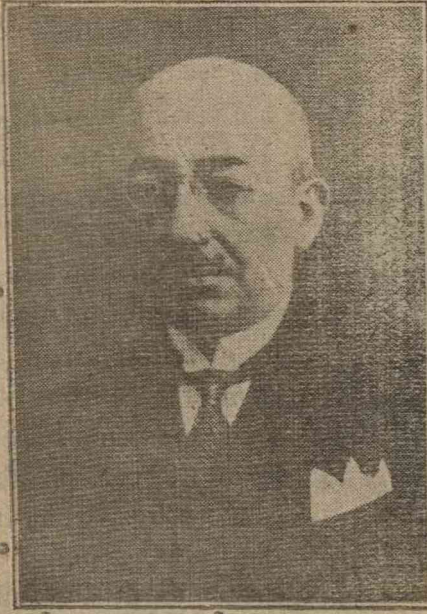
Sayın Başvekilimiz Dr. Refik Saydam

Bugün, ilk 14 Halkevi'ni kurduğumuz günün dokuzuncu yıldönümüdür. Şimdiye kadar 379 Halkevi 141 Halkodası açmış idik. Bugün yeniden 4 Halkevi ve 57 Halkodası açıyorum. Bu suretle 383 Halkevi ve 198 Halkodası kültür ve sosyal çalışmalarında türk vatandaşlarına kılavuzluk edecektir. Aynı zamanda