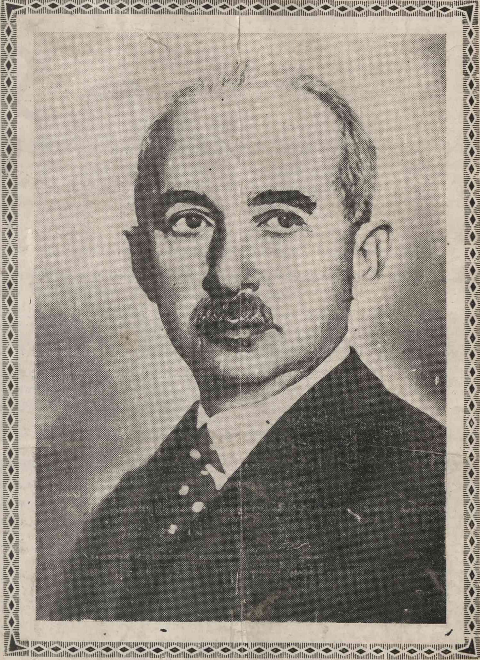
MİLLÎ ŞEFİMİZ İSMET İNÖNÜ