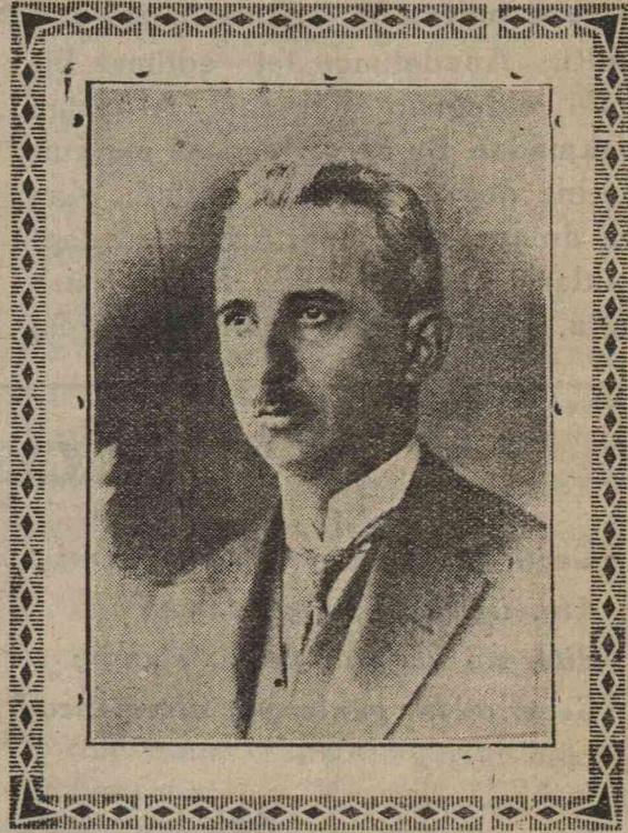
Cümhur Reisimiz İsmet İnönü

Milli ordunun daha ziyade büyümesine meydan vermemek için acele eden düşmanlarımız 23 mart 1921 de Bursa, Bilecik ve Pazar köy üzerinden üç koldan harekete geçtiler. Bir yanını Sakaryaya diğer yanını dağlara virmiş olan milli kuvvetler 27 martta düşmanını karşıladı, Müte-